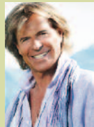
Chart-Stürmer Hansi Hinterseer geht im Frühjahr 2012 gemeinsam mit dem „Tiroler Echo“ auf Europa-Tournee. Seine beliebten volkstümlichen Schlagerhits werden am 6. und 10. Februar in Dresden und Chemnitz sowie am 16. März in Erfurt die Besucher in alpenländische Stimmung versetzen. Infos und Karten an allen bekannten Vorverkaufsstellen, für Erfurt unter 0180 5 607070* und www.argo-konzerte.de