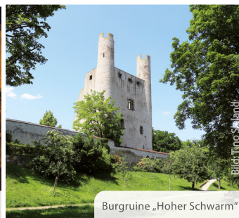
Burgruine „Hoher Schwarm“