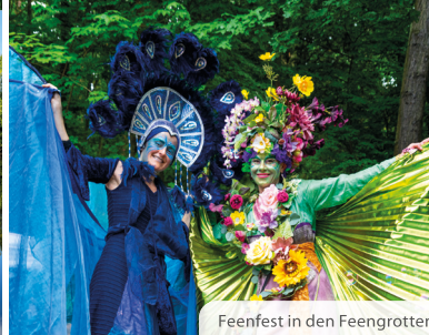
Feenfest in den Feengrotten