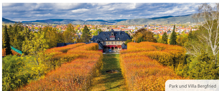
Park und Villa Bergfried